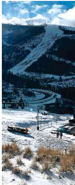
Área externa do parque olímpico de Utah

O penduricalho, que em alguns dos casos pode chegar a R$ 1 milhão, refere-se a compensação por absorver uma carga extra de processos, além da cota regular. Política A6